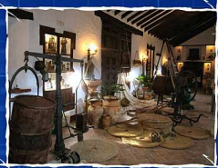
CENTRO DE INTERPRETACIÓN DEL CAMPO ANDALUZ CASERÍO DE SAN BENITO. ANTEQUERA